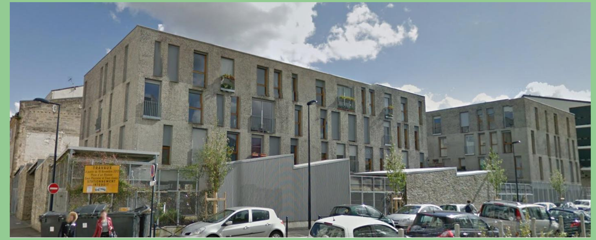
Réalisation des plans et notes de calculs de plusieurs ouvrages de serrurerie d'une résidence Bordeaux Quai de Bacalan (33)