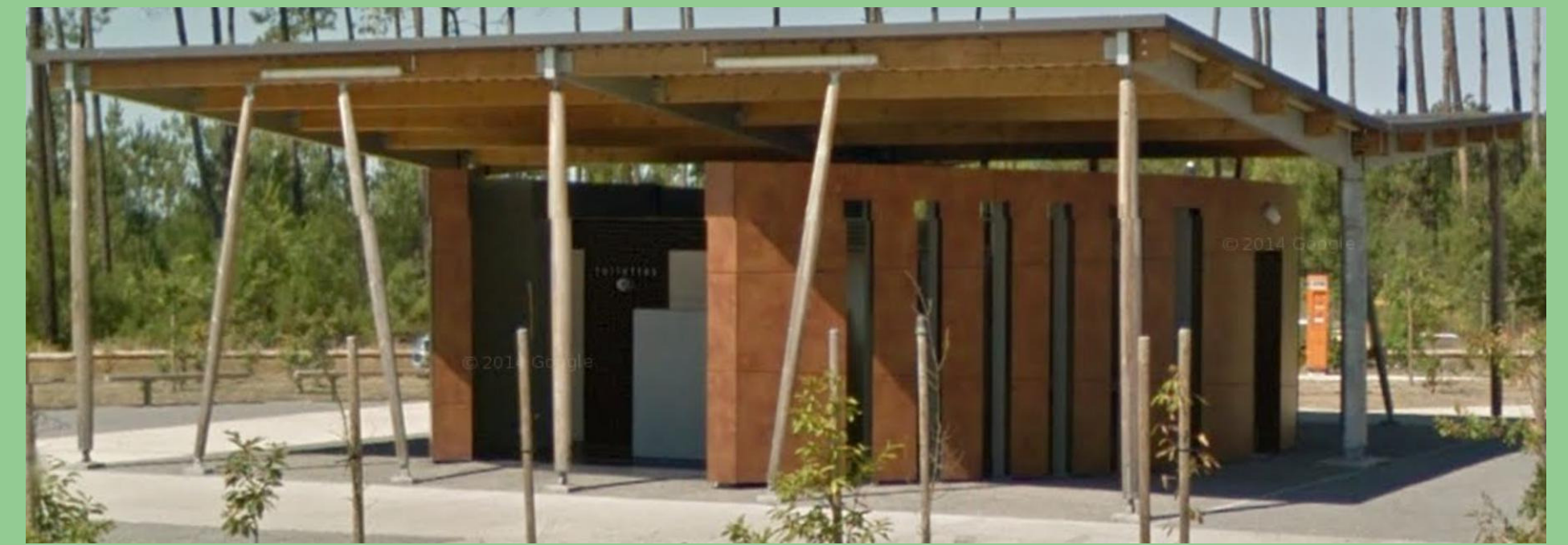
Réalisation des plans de présentation et de fabrication des toilettes des aires de repos des ASF fabriquées par l'entreprise DL Aquitaine