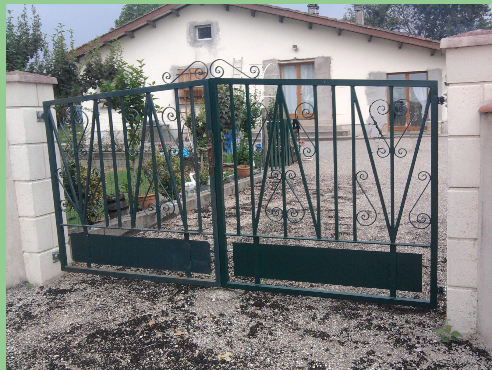
Fabrication et pose d'un portail métallique avec ferronneries - Lot et Garonne (47)