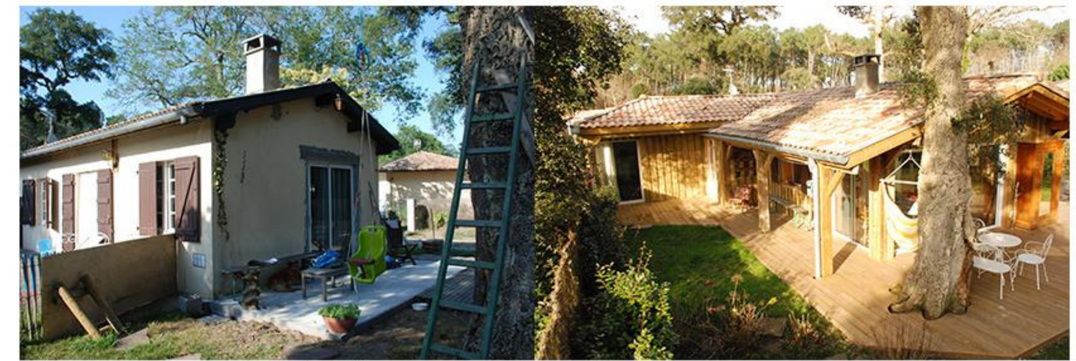
Rénovation et extension d'une maison - SEIGNOSSE (40) - Extension en ossature bois - isolation ouate de cellulose Surface de plancher: avant: 40m 2 - après: 60m 2 MISSION: CONCEPTION ET SUIVI DES TRAVAUX