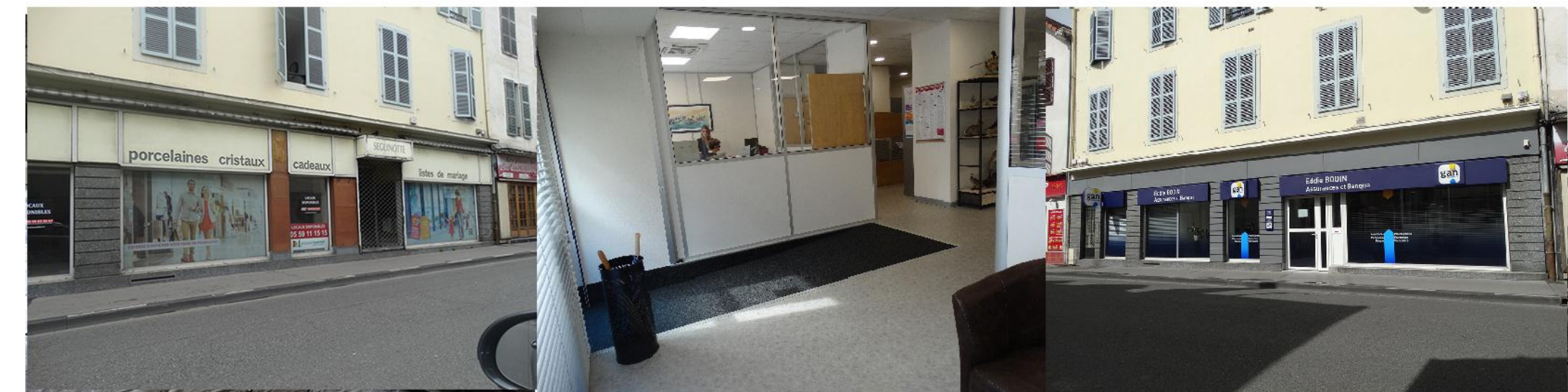
Réhabilitation d'un ancien local commerciale en bureaux pour «GAN Assurances» - PAU (64) - MISSION: CONCEPTION, DÉPOT DES AUTORISATIONS DE TRAVAUX (ERP - DP) ET SUIVI DES TRAVAUX Surface de plancher: 184 m 2 - Contraintes d'accessibilité handicapé: création de rampe d'accès depuis la voie publique Projet situé dans une «Zone de Protection du Patrimoine Architectural, Urbain et Paysager»