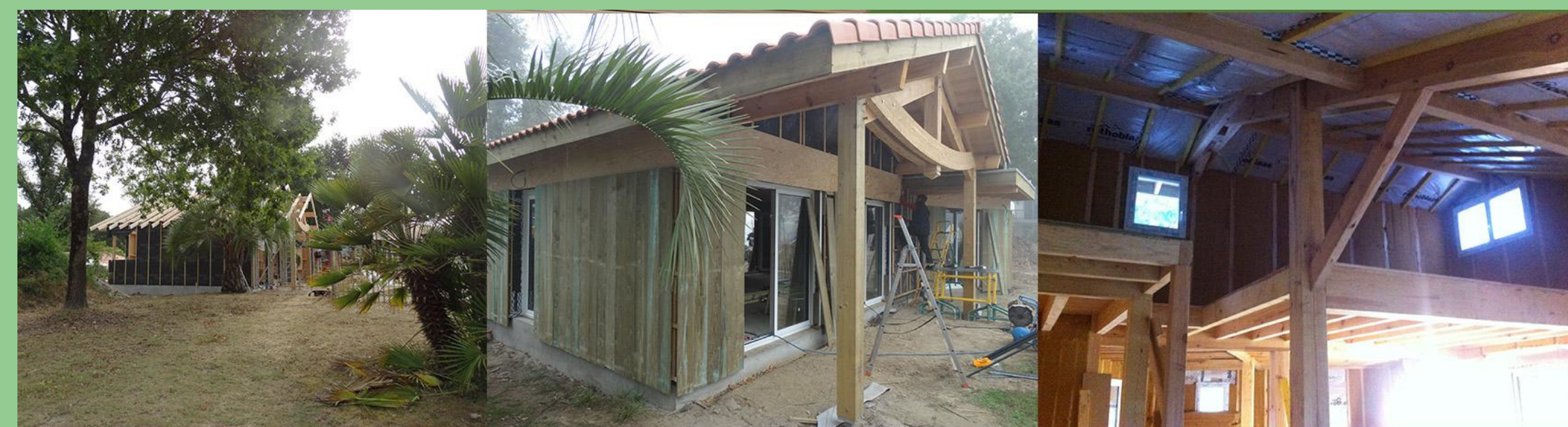
Maison à MESSANGE (40) Ossature bois avec isolation fibre de bois Bardage en pin maritime traité classe 4 Surface de plancher: 90m 2 MISSION: coordination des travaux