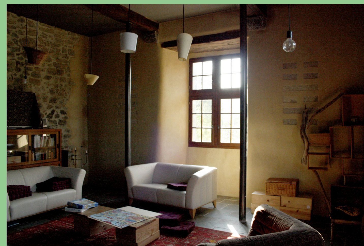
Enduits chaux chanvre projetés (300m 2 ) et enduits de finition terre (100m 2 ) Saint Esteben (64) - 2012