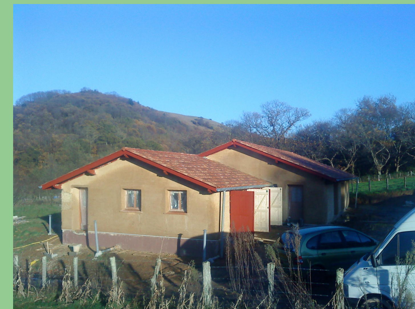
Implantation, fondations, mur de soubassement, vide sanitaire, dalle BA, isolation en botte de paille, enduits terre int/ext. Maison individuelle 190 m 2 . Macaye (64) - 2009

"Diplômé d'un DUT en Gestion du Développement et de l'Action Humanitaire de l'Université Bordeaux III en 2003.