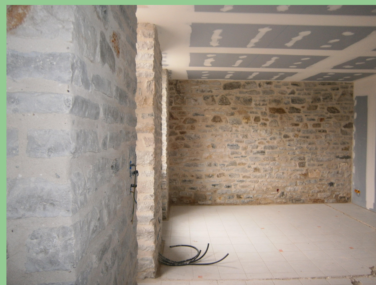
Rejointement de moellons à la chaux. Enduits chaux chanvre et enduits de finition chaux sable coloré Bayonne (64) - 2015