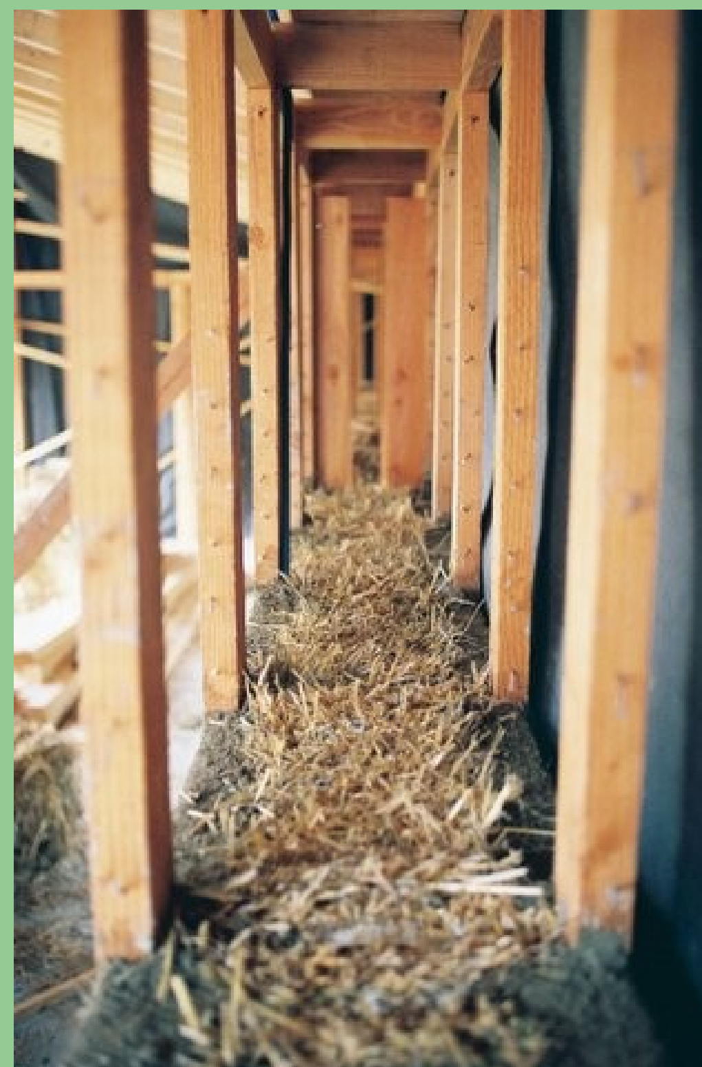
Construction d'une maison ossature bois et remplissage paille selon la technique GREB. Architecte Orane Garrigos