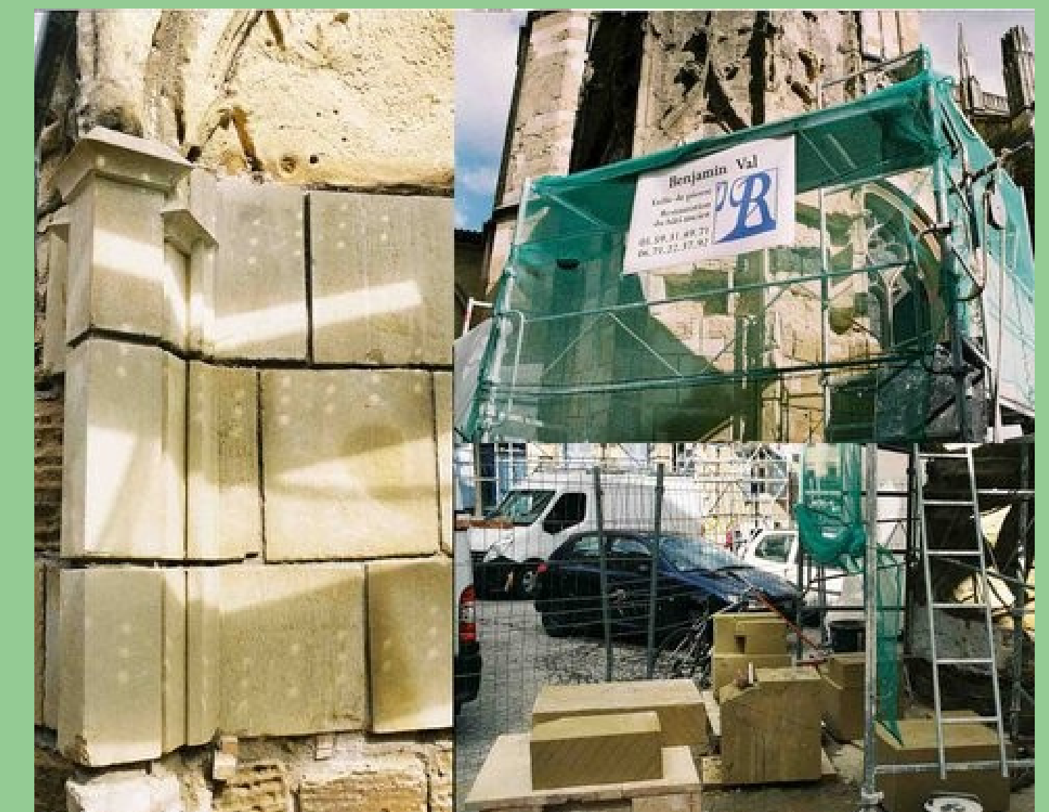
Taille et remplacement de pierre de grès de Mousserolles sur la Cathédrale Ste Marie de Bayonne