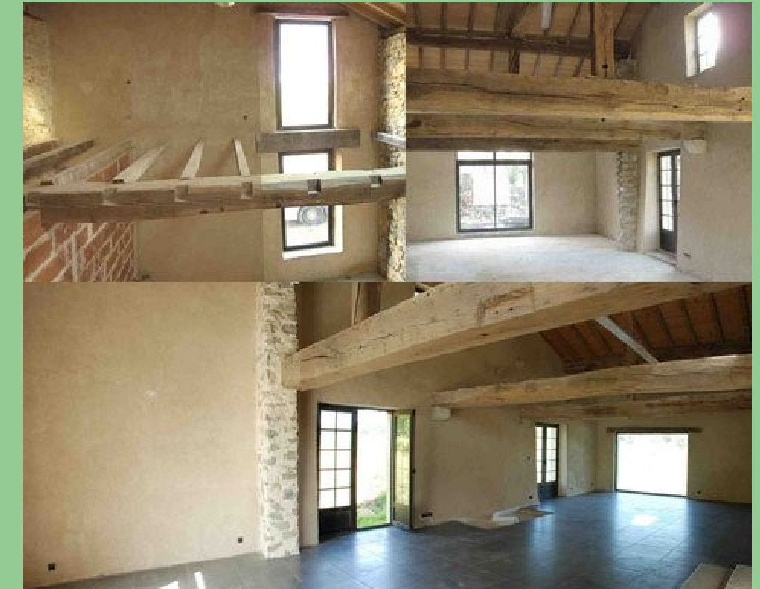
Percement d'ouvertures dans les murs d'une maison en pierre , et réalisation d'un enduit chaux-chanvre sur les murs intérieurs

"Après un cursus de 4 ans en Ecole d'architecture, je me dirige vers le métier de tailleur de pierre ; je crée mon entreprise en 2004 et travaille notamment à la restauration du centre-ville de Bayonne. En 2011, je construis une maison en bois & paille et décide d'intégrer la Coopérative Habitat Eco-Action en octobre 2016."