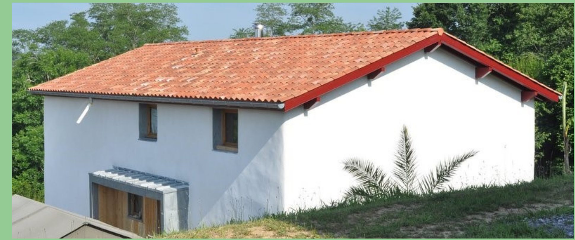
Enduit à la chaux en trois couches sur une maison en paille Villefranque (64)

"Après un cursus de 4 ans en Ecole d'architecture, je me dirige vers le métier de tailleur de pierre ; je crée mon entreprise en 2004 et travaille notamment à la restauration du centre-ville de Bayonne. En 2011, je construis une maison en bois & paille et décide d'intégrer la Coopérative Habitat Eco-Action en octobre 2016."